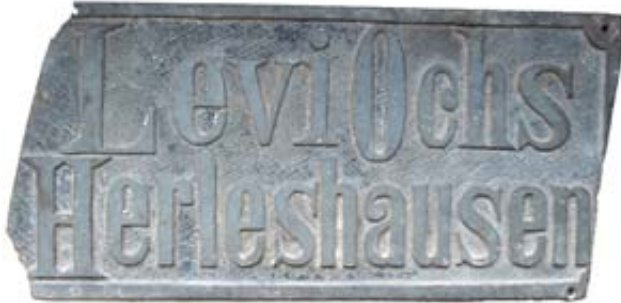
Fragmente des Firmenschildes vom Viehhändler Levi Ochs, Bahnhofstraße 1

Für die Zinsen wurden Bücher gekauft, die jeweils am 08.01. an Schüler für Fleiß, Aufmerksamkeit und gutes Betragen mit entsprechender Widmung überreicht wurden.