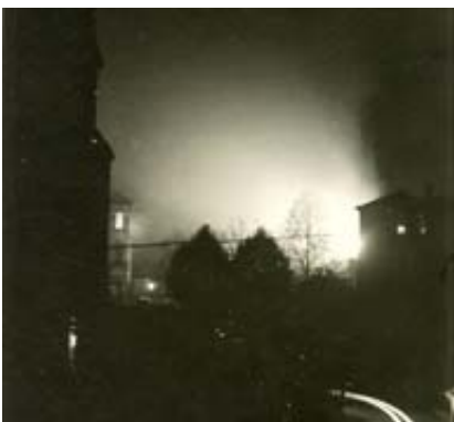
Die Synagoge brennt!

Den Höhepunkt der Ausschreitungen bildete die Zerstörung der Synagoge. Sie soll sich folgendermaßen abgespielt haben: „Angehörige der Hitler-Jugend drangen nach Demolierung der Buntglasfenster in das Gebäude ein und zerstörten außer der Bestuhlung, der Orgel, dem Leuchter und dem Toraschrank auch das Bronzedenkmal mit den Namen der 23 Gefallenen der jüdischen Gemeinde im Ersten Weltkrieg. Nur die Torarollen konnten gerettet werden. ...“ Am späten Abend legten dann SA-Männer im zerstörten Synagogengebäude Feuer. Die anrückende Feuerwehr wurde am Löschen gehindert, bis das Gebäude niedergebrannt war.