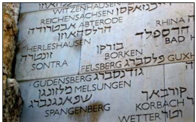
(Ausschnitt vom Bild oben, linke Seite)