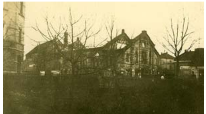
Nach der Pogromnacht in Eisenach