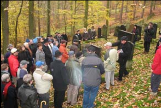
Helmut Schmidt informiert am Grab des letzten Vorbeters Alexandrowitz die Bedeutung des jüdischen Friedhofes.

Die einzigen sichtbaren jüdischen Spuren, die in Herleshausen noch vorhanden sind, findet man auf dem jüdischen Friedhof, und es war gut, dort den Tag beginnen zu lassen. Etwa 75 Personen aus Herleshausen, Hørschel, Neuenhof und Eisenach waren der Einladung zum jüdischen Friedhof gefolgt. Eisenacher Juden wurden bis zu Beginn des 19. Jh. in Herleshausen beerdigt, da seinerzeit in Eisenach noch kein jüdischer Friedhof angelegt war.