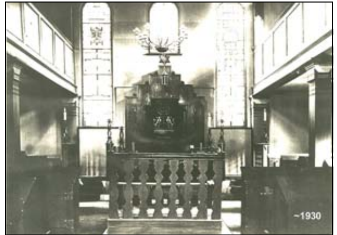
Die Innenansicht der Synagoge in Herleshausen

Direkt hinter uns befand sich bis zum 9. November 1938 die Synagoge der in Herleshausen lebenden jüdischen Gemeinschaft. Ein Haus der Geborgenheit, Stille und Andacht, der Zusammenkunft und des Gebets und vor allem ein Ort der Sicherheit, der Freude und besonders der Begegnung. Es sind Attribute eines gemeinschaftlichen, geistlichen Lebens, die über Jahrhunderte der hier ansässigen jüdischen Bevölkerung Zuversicht und Hoffnung gaben.