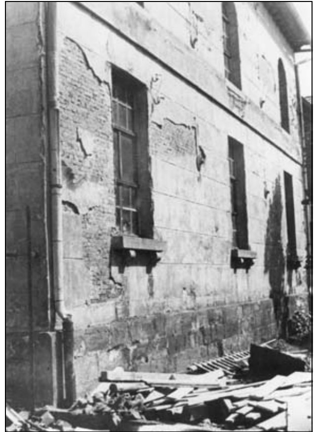
Außenansicht der Herleshäuser Synagoge. Das Foto stammt möglicherweise aus der Zeit vor der grundlegenden Renovierung im Jahre 1928

Während die am Anger wohnenden Juden zwischen ihrem demolierten Eigentum weinend und jammernd gesehen wurden, soll ein Lehrer des Ortes am 10. November mit den älteren Schülern die verwüstete Synagoge „besichtigt“ haben. Dabei sollen noch restliche Fenster zerschlagen und Gegenstände demoliert worden sein.