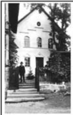
Synagoge um 1930

Das Vergessenwollen verlängert das Exil, und das Geheimnis der Erlösung heißt Erinnerung. Jüdische Weisheit