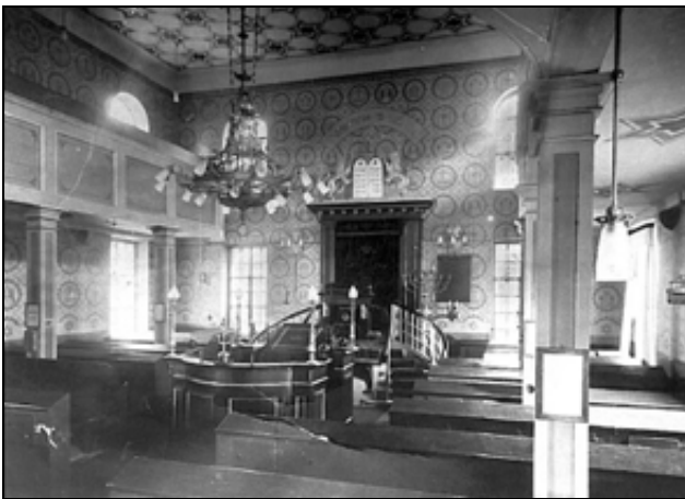
Die Eschweger Synagoge

Der folgende Bericht schildert, wie die Wohnungen von jüdischen Mitbürgern in Eschwege verwüstet wurden: