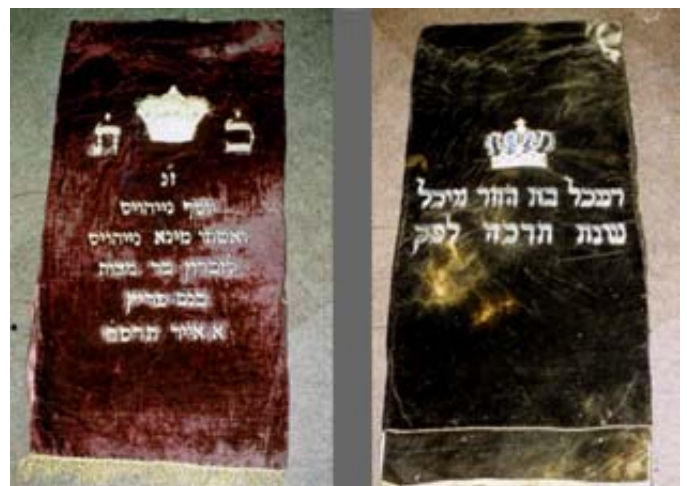
Die Tora-Mäntel, die man in den 1970er Jahren auf einem Dachboden in Herleshausen fand, wurden der Gedenkstätte Yad Vashem/Israel übergeben. Die ursprünglich angebrachten Edelsteine fehlten allerdings.

„Wer Mut hat, kommt mit!“ war die Parole. Die örtlichen Parteiführer wussten offenbar, dass „offizielle“ Aktionen verboten, aber „spontane“ Aktionen erwünscht waren. Die Braunhemden wurden deshalb auch in Herleshausen in Zivil umgetauscht. Man holte sich außerdem „Werkzeug“, z. B. Brecheisen und Beile. Es scheint auf dem Anger angefangen zu haben. An zahlreichen Wohnungen und jüdischen Geschäften wurden zunächst die Fensterscheiben eingeworfen. An diesen Aktionen sollen nicht nur Parteigenossen aus Herleshausen, sondern auch aus einigen Nachbargemeinden teilgenommen haben. Insgesamt sollen 15 bis 20 Personen beteiligt gewesen sein.