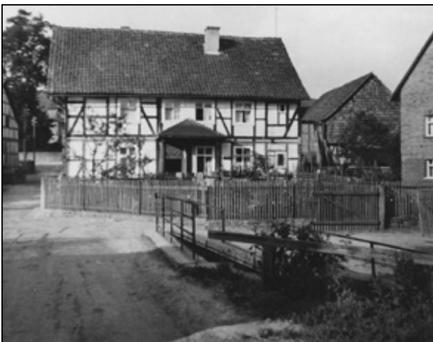
Ehem. Judenschule in Nesselröden, Wildengraben