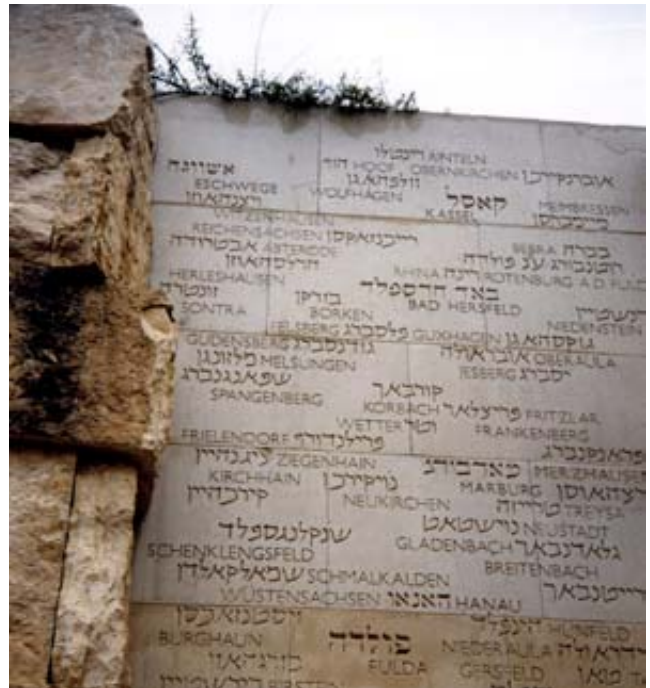
Herleshausen ist dabei:

Auf 107 Steinwänden wird hier an über 5.000 jüdische Gemeinden erinnert, die während der Shoah ganz oder teilweise vernichtet wurden.