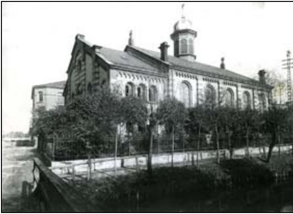
Die Eisenacher Synagoge (heute: Karl-Marx-Str.)