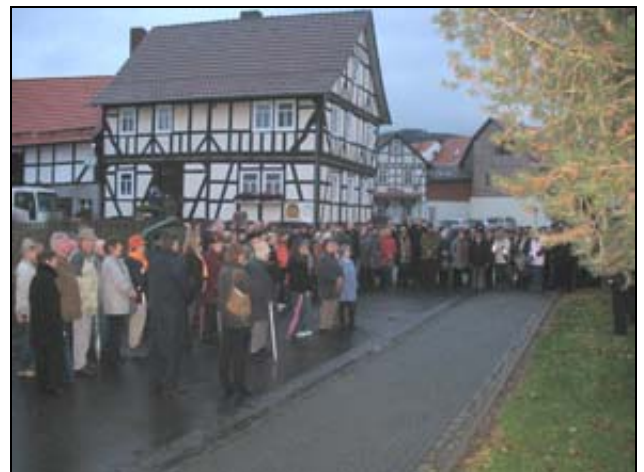
Zahlreiche Gäste waren erschienen, um der Enthüllung der Gedenktafel beizuwohnen.

Ca. 150 Personen stellten sich trotz ungünstiger Wetterlage in der Lauchröder Straße ein, um der Enthüllung der Gedenktafel beizuwohnen. Trotzdem hat es wohl niemand übel genommen, dass der Gottesdienst etwas länger gedauert hat.