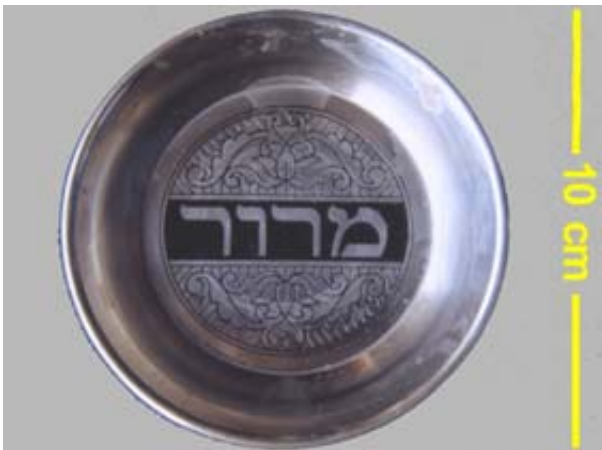
Ein letztes verbliebenes Zeugnis aus der Synagoge 4)

Die NSDAP-Ortsgruppe hatte am 9. November zu einer Versammlung in das Gasthaus Schneider eingeladen. Dabei handelte es sich ursprünglich wohl um eine Veranstaltung, bei der des Hitler-Putsches im Jahre 1923 gedacht werden sollte. An diesem Abend sollten auch einige Jugendliche in die Partei und die SA aufgenommen werden. Der Charakter der Veranstaltung änderte sich aber in Herleshausen, wie in den anderen Orten, durch das Attentat am 7. November auf den deutschen Diplomaten Ernst vom Rath in Paris.