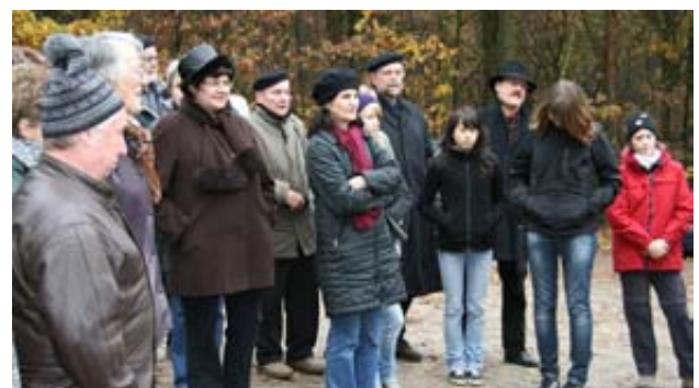
Erfreulicherweise nahmen auch zahlreiche Jugendliche an den Veranstaltungen teil.