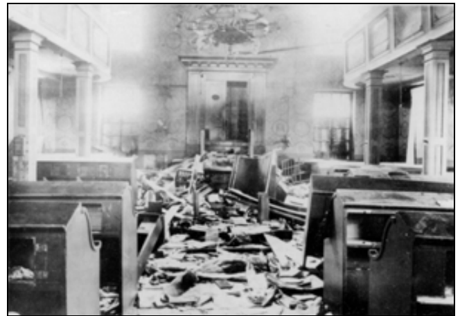
Die zerstörte Eschweger Synagoge, Nov. 1938

an der Wohnung ihre Zerstörungswut aus. Mit scharfen Messern schlitzten sie die Polstermöbel auf, beschädigten die Ölgemälde, zerschnitten die Kleider und zerschlugen die Möbelstücke.