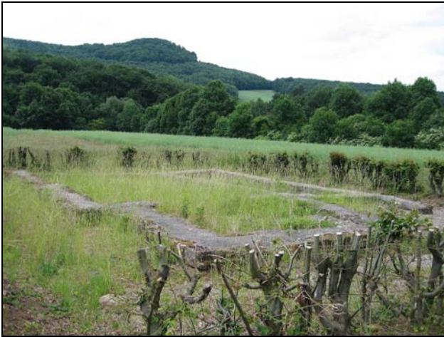
(Bergkuppe = Ruine Boyneburg)

Im weiteren Bereich des heutigen Hofes Harmuthshausen lag im Mittelalter eine größere dörfliche Siedlung von bislang unbekannter Größe und Ausdehnung. Um 1320 erste sichere Nennung als „Hademarishusen“ mit drei Höfen im Besitz derer von Boyneburgk. 1367 und 1370 Güter in „Hademorshusin“ im Eigentum dieser Familie und anderer Grundbesitzer.